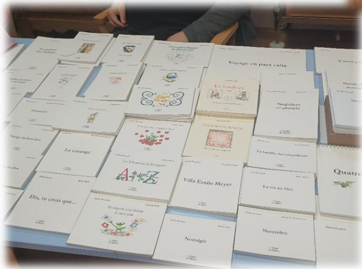
Projet « Lire et Faire Lire » en partenariat avec l'UDAF et « l'Atelier des noyers » de Dijon.